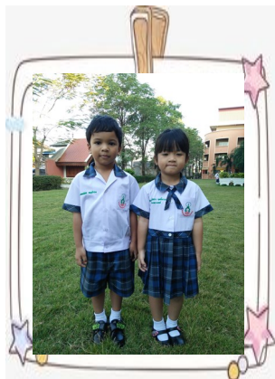
ชุดวันพระประจำโรงเรียน

ชุดพลละ (ปักชื่อ-สกุล) ด้วยไหมสีเขียวหน้าอกด้านขวา