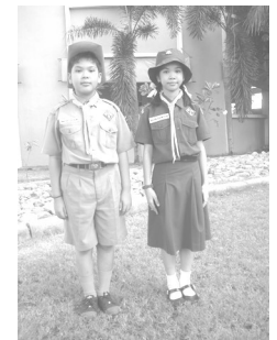
ชุดลูกเสือ-เนตรนารีสามัญ