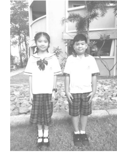
ชุดนักเรียน