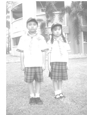
ชุดลูกเสือ-เนตรนารีตำรวจ